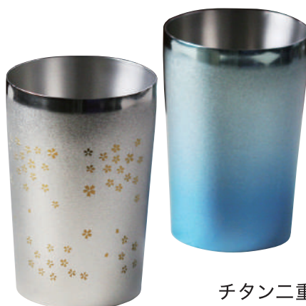
チタン二重タンブラー