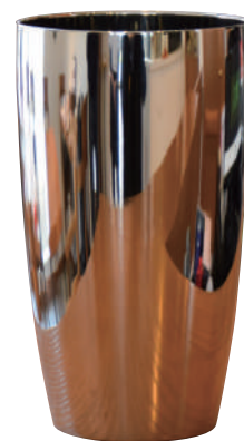
ステンレス製タンブラー