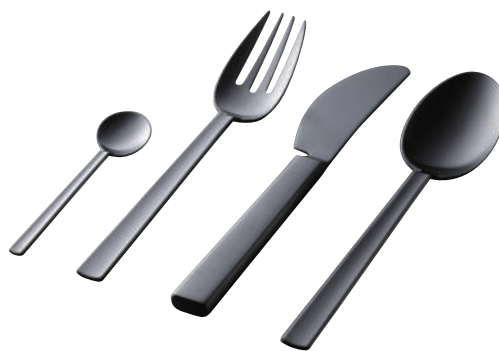
ステンレス製洋食器(チタンコーティング処理)