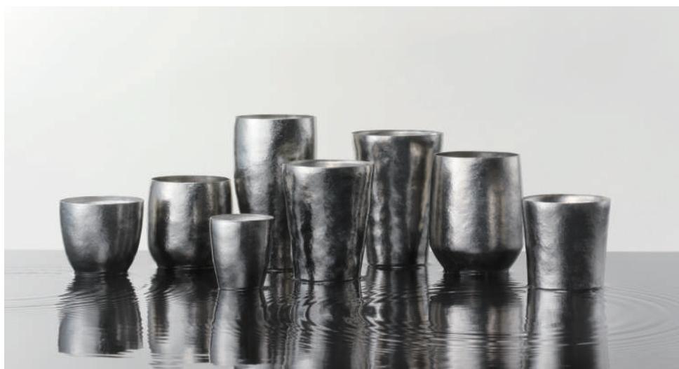
チタン真空二重タンブラー